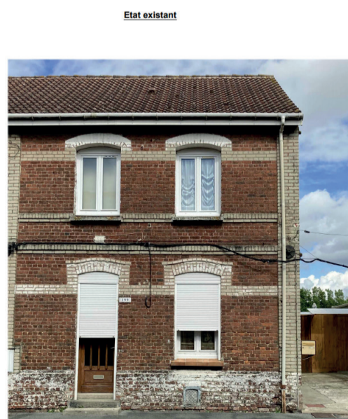
Exemple de façade avant travaux (199 rue de Colombie)

Extrait du descriptif des travaux - type A ter