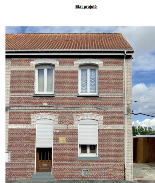
Exemple de façade après travaux (199 rue de Colombie)